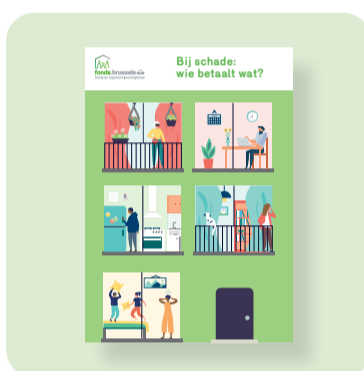
Wie betaalt wat?

> Raadpleeg onze Huurdersgids op www.fonds.brussels